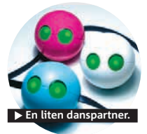
► En liten danspartner.

Med Bodybugbollen har du alltid någon att dansa med.