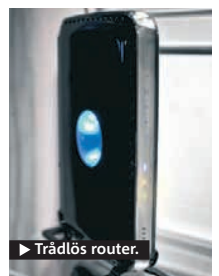
► Trådlös router.