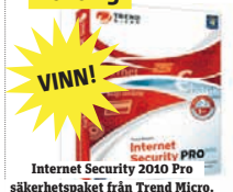
Internet Security 2010 Pro säkerhetspaket från Trend Micro.

► Fråga: Motorola ska lansera en Androidtelefon under kodnamnet Sholes. Men vem var Christopher Latham Sholes?