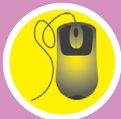
Mest klickat på metroteknik.se den senaste veckan.

► Om du vill sitta stilla kan du även spela rörelsestyrda spel på Bodybugs egen skärm.