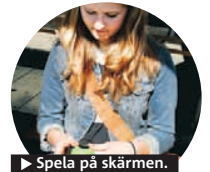
► Spela på skärmen.

► Bodybug reagerar på dina rörelser och kan även dansa själv. Kan användas nästan var som helst.